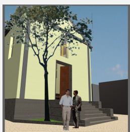
Chiesa Cimitero Terzigno